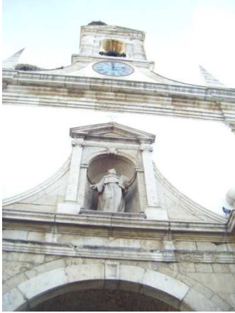
Monumento de la catedral de Faro