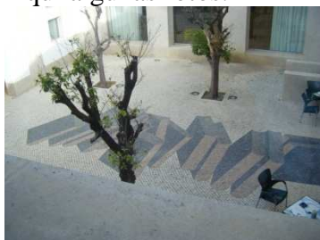
Aquí el patio de la biblioteca de faro.