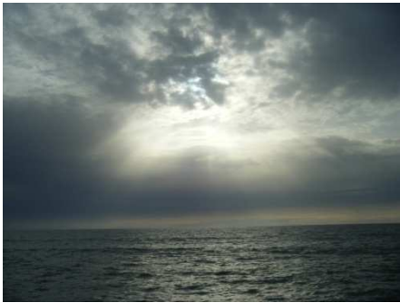
Foto del cielo desde la playa de Faro.