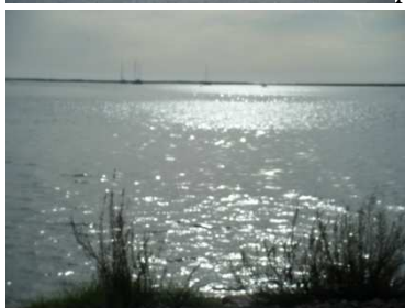
La playa de faro