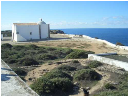
Ermita y mar de la fortaleza de Sagres.